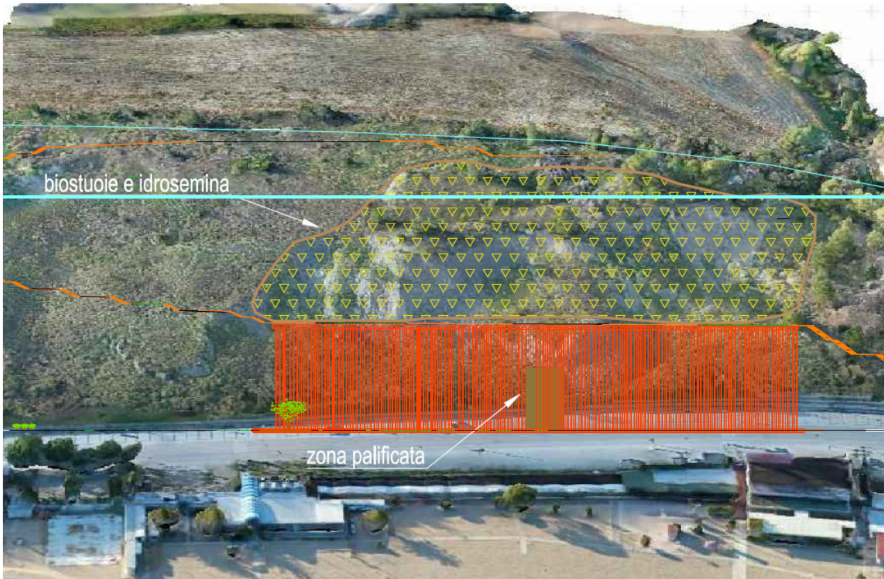
Fig. 1: stralcio della tavola di progetto A15.